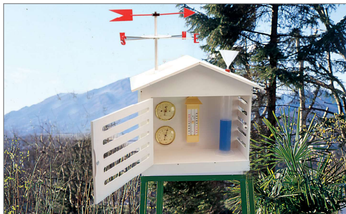
2084 su 2061